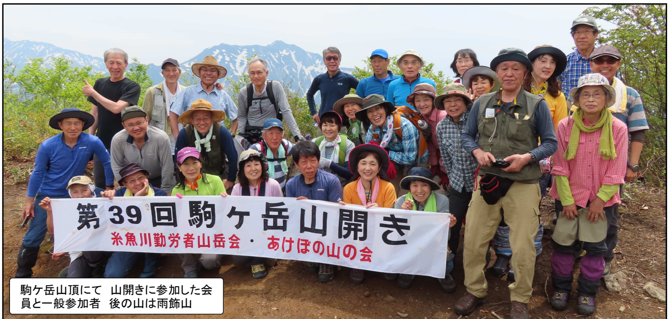
駒ヶ岳山頂にて 山開きに参加した会員と一般参加者 後の山は雨飾山

★「安全登山2019ハンドブック」をお届けしました。必ず読んでいただいて「安全登山」をするために活用してください!