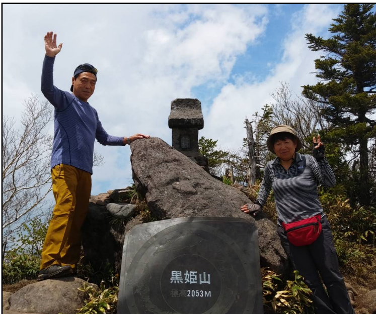
〈写真〉＝左 長野・黒姫山にて(6/1 野本) 下 市内・美山公園で美しいなササユリに 出会いました(5/30 野本)