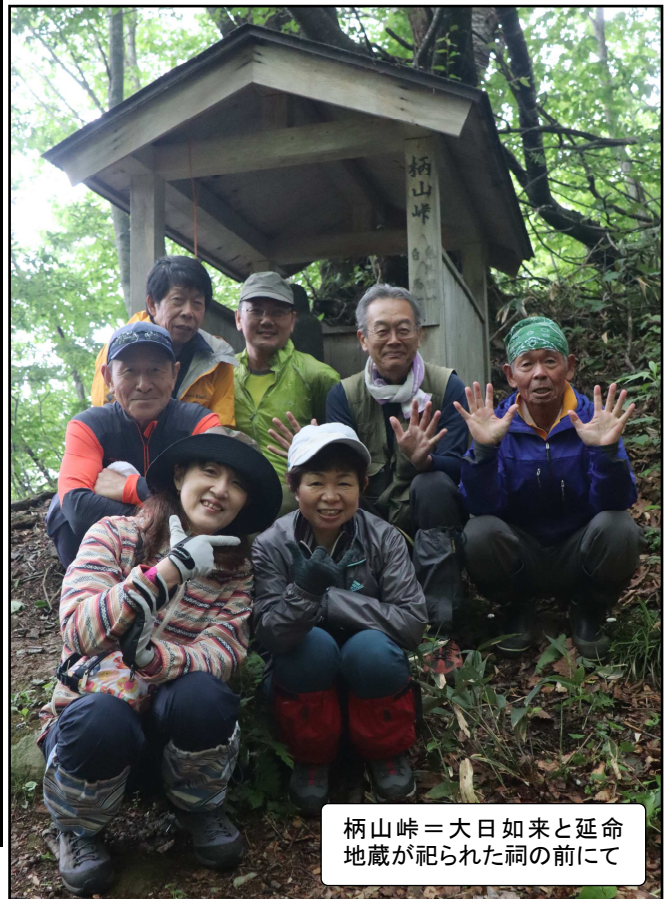
柄山峠=大日如来と延命地蔵が祀られた祠の前にて

▼ランチ後、『カフェ・ヨッチャン』ではコーヒー豆を挽くお手伝い。おお~いい香り♥金沢から仕入れた本格派コーヒーなんだって!Hさ