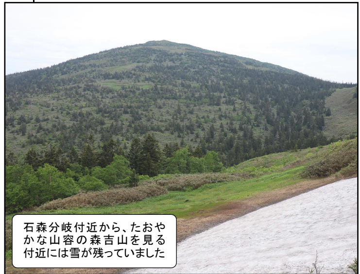
石森分岐付近から、たおやかな山容の森吉山を見る付近には雪が残っていました

お礼参り。近くの湿原にはヒナサクラがたくさん咲いていた。いろいろな花を楽しみながらゴンドラ山頂駅に戻る。少し雨に降られたが、森吉山を訪れてよかった。(加藤)