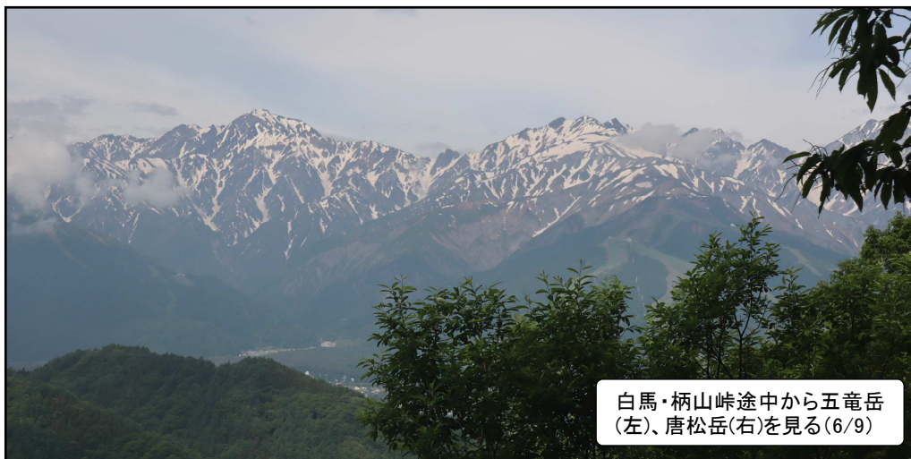
白馬・柄山峠途中から五竜岳(左)、唐松岳(右)を見る(6/9)