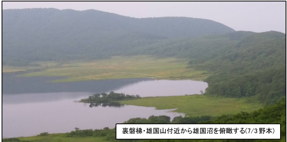
裏磐梯・雄国山付近から雄国沼を俯瞰する(7/3 野本)

▼ラピス°裏磐梯…1時 間 50分…雄国山…30 分…ビジターセンター 2時 間…雄国沼散策…ビ ジターセンター…30分… 雄国山…1時間 30分 …ラピス°登山口