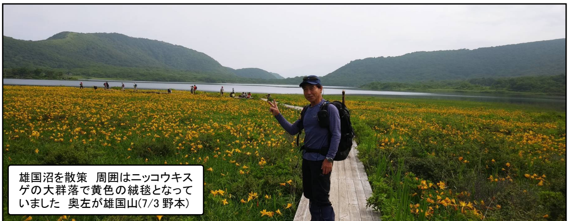
雄国沼を散策 周囲はニッコウキス ゲの大群落で黄色の絨毯となっ ていました 奥左が雄国山(7/3 野本)