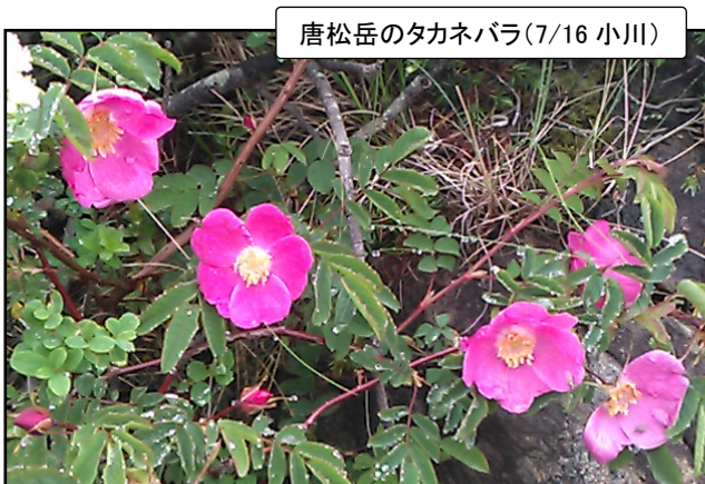
唐松岳のタカネバラ(7/16 小川)