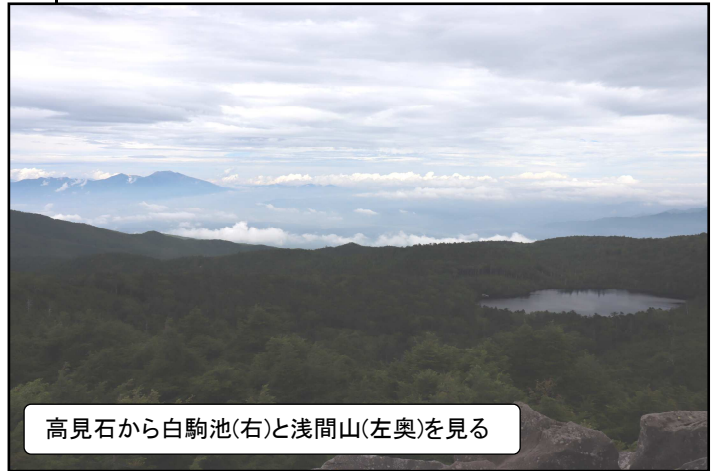
高見石から白駒池(右)と浅間山(左奥)を見る

天気予報はあまりよくなくて雨の心配をしたが、雨にあうこともなく一時日差しもあつて、北八ヶ岳の一部を楽しむことができた。(加藤)