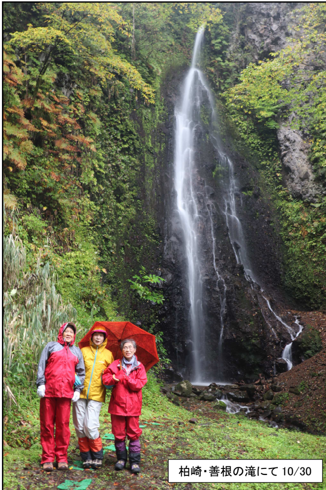
柏崎・善根の滝にて 10/30