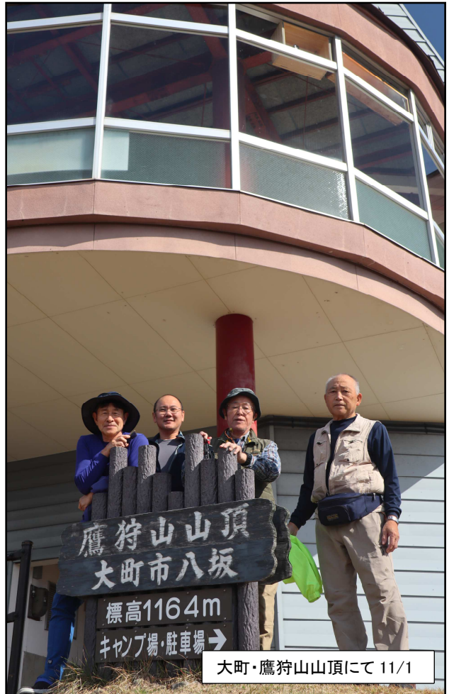
大町・鷹狩山山頂にて 11/1