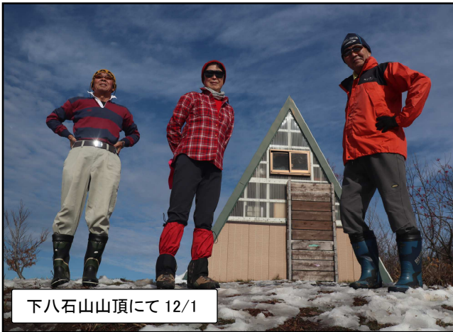
下八石山山頂にて 12/1