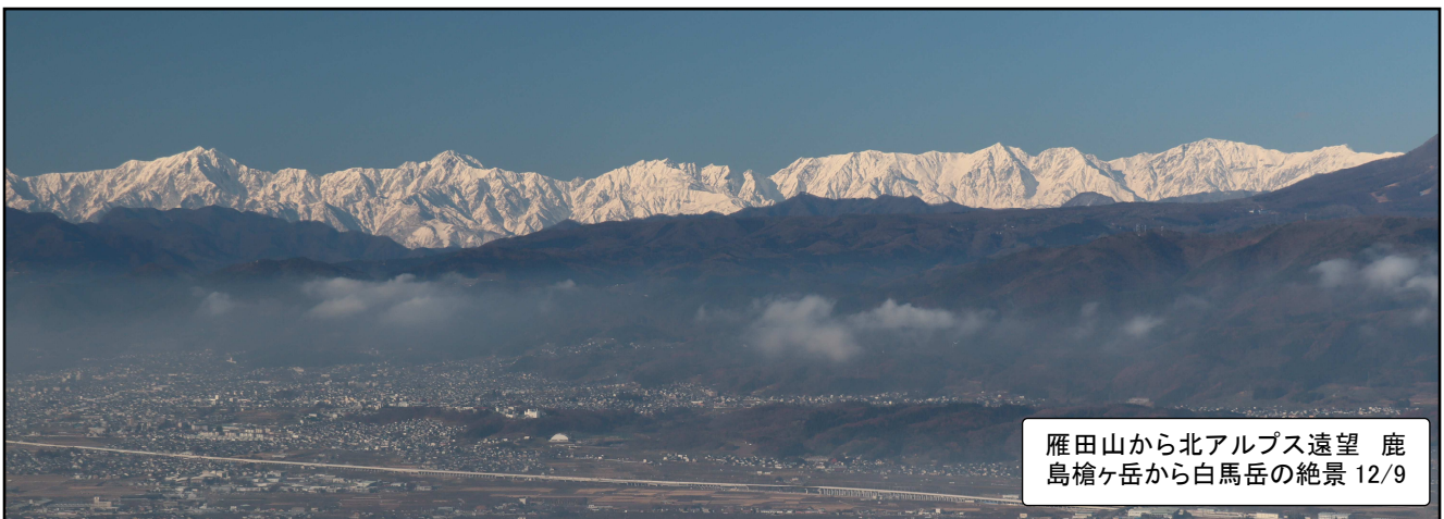
雁田山から北アルプス遠望 鹿 島槍ヶ岳から白馬岳の絶景 12/9