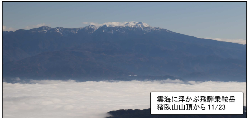
雲海に浮かぶ飛騨乗鞍岳 猪臥山山頂から 11/23