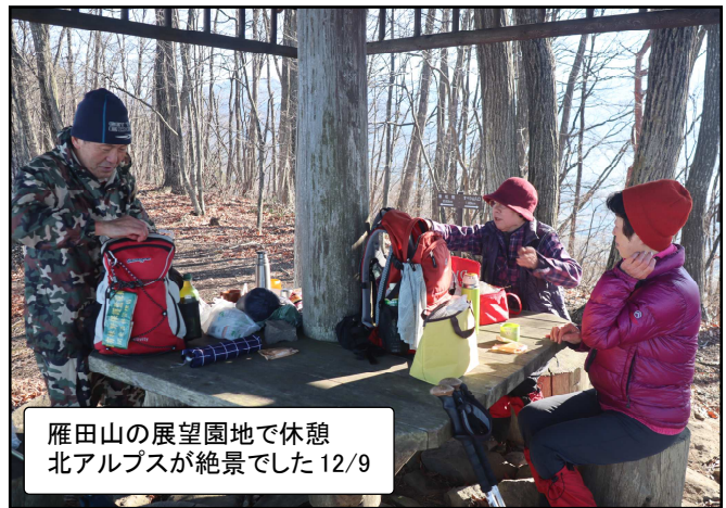
雁田山の展望園地で休憩 北アルプスが絶景でした 12/9