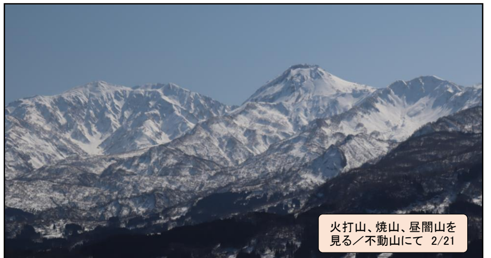
火打山、焼山、屋間山を見る／不動山にて 2/21