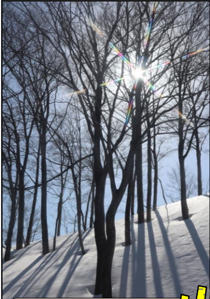
陽春の日差しを受けながら山頂に向かう／放山にて 2/24