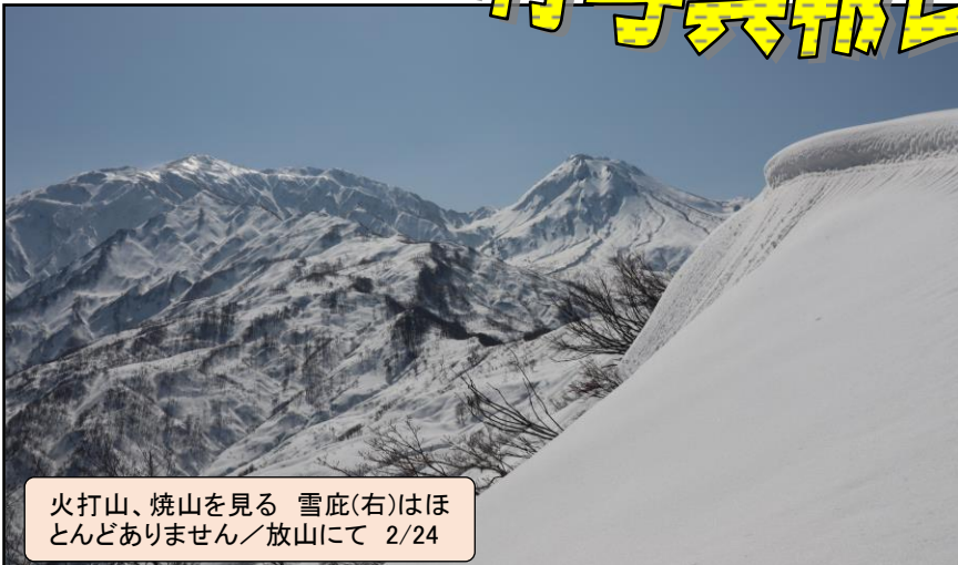
火打山、焼山を見る 雪庇(右)はほとんどありません／放山にて 2/24