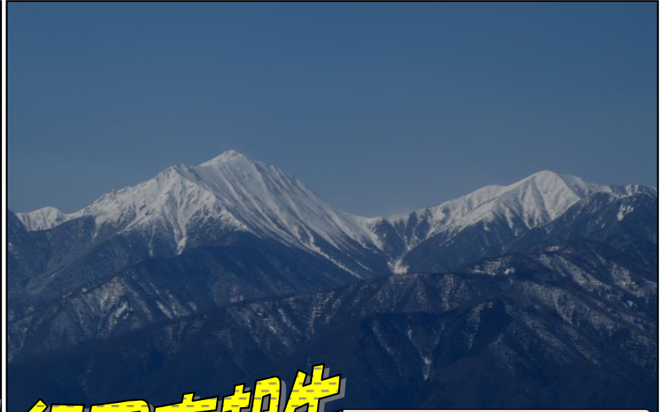
大きな山容の常念岳(左)は迫力がありました 右は横通岳／長峰山にて 2/24