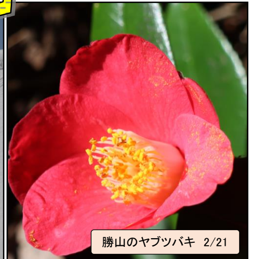
勝山のヤブツバキ 2/21